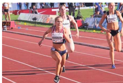
20-åringen satte norgesrekord på 200 meter på Bislett i fjor med tiden 23,27.